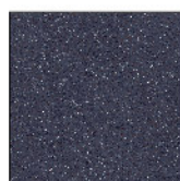
9022 Blue Nebula