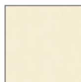
D 30 Beige Solid