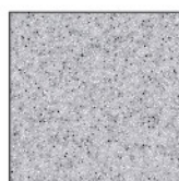
9194 Grey Nebula