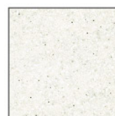
9173 Everest Salt