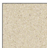
1530 Beige Nebula